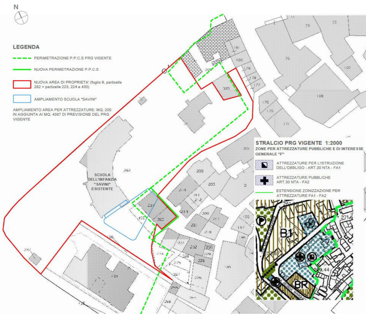
Stralcio Tavola Inquadramento dell'Arch. Oresti