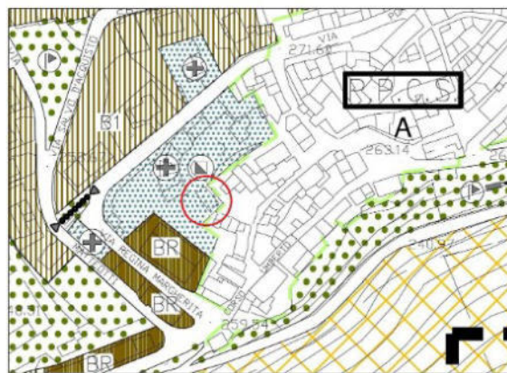
Stralcio PRG di Variante parziale al PRG