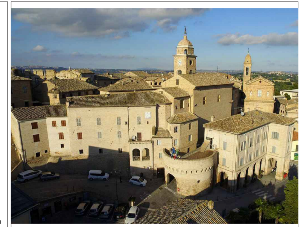
PIANO ATTUATIVO DI RICOSTRUZIONE POST SISMA 2016 CENTRO STORICO PETRIOLO

Relazione Geologica: Geologo Fabio Mariani, Via G.B. Velluti, 118 - 62100 Macerata